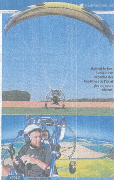
A la découverte du buggy volant à Bailleul-le-Soc

■ Dimanche à Bailleul-le-Soc , sur rendez-vous. Tarif : de 60 € (20 minutes) à 280 € (1 h 45). Dès 12 ans. Tél. 06.89.65.88.51.